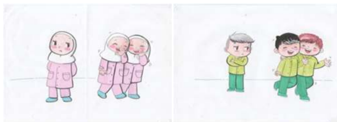
شکل ۹. روابط (استفاده شده برای دختران) شکل ۱۰. روابط (استفاده شده برای پسران)