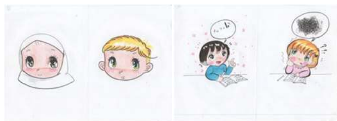
شکل ۲. دو دختر شبیه هم