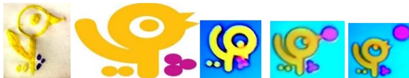
تصویر ۱۱ الف: آرم شبکه پویا با حرکت های بصری آن. نوشتار تداعی کننده تصویر یا شمایل تصویر ۱۱ ب: نقاشی کودک از آرم شبکه پویا (www.pooyatv.ir)