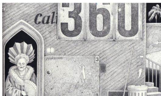
تصویر ۴. صفحه ۱۹، شب هشتم. شب‌گرد، (۲۰۱۵).

حس (Sense) در زبان انگلیسی به معنی «گنجایش فیزیولوژیک یک موجود زنده برای ادراک است». بر اساس تعریف سستی که ریشه آن به ارسطو برمی‌گردد، پنج حس در انسان وجود دارند: «بینایی، شنوایی، بویایی، چشایی و آوایی» که به آنها «حواس پنج‌گانه» می‌گویند (URL 4). در داستان، توصیفی از شب هشتم آمده است، هیچ تعقیبی مثل تعقیب دیگر نبود، هر دفعه این خانم به‌جای جدید می‌رفت، به همین دلیل آن‌ها وسایلی نظیر کفش، لباس‌های تیره‌رنگ، چراغ‌قوه و مقداری مواد غذایی برای خودشان آماده کرده بودند و به‌شکلی منظم کنار کمدشان گذاشته بودند تا زمانی که آن خانم از منزل خارج می‌شود، او را تعقیب کنند. بچه‌ها با شنیدن صدایی تصور می‌کنند که او رفته است، پس به حیاط می‌روند تا او را تعقیب کنند، اما متوجه می‌شوند که او اصلاً بیرون نرفته و دقیقاً روبروی بچه‌ها ایستاده و آن‌ها نگاه می‌کند و