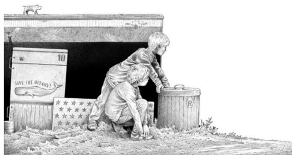
تصویر ۳. صفحه ۷، شب سوم. شب‌گرد، (۲۰۱۵).

زبانی فصیح و رسا بیان می‌کند، «کسی که می‌خندد، شیء را به دستان نترس آزمایش تحقیقی می‌رساند» (Murriss, Haynes, 2012).