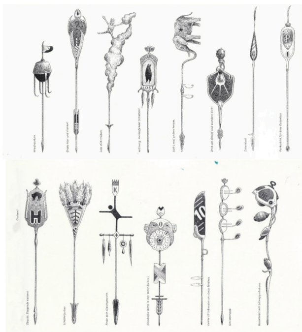
تصویر ۵. صفحه ۱۶ و ۱۷، شب هفتم. شب‌گرد، (۲۰۱۵).

یک لبخند دوستانه تحویل آن‌ها می‌دهد که این لبخند (تمثیل) بسیار جذاب بوده است. در آن لحظه کسی به فکر تعقیب نیست و تنها چیزی که آن لحظه می‌شد گفت، این بود که «خانم مارلوت یک حال خوبی داشت» (تصویر ۴). به خاطر هیجان زیاد بچه‌ها برای تعقیب خانم مارلوت، اشتباهی در شنیدن صدا پیش می‌آید، این صدا ادراکی برای دیدن خانم مارلوت بود و به همین دلیل آن‌ها به اشتباه با شنیدن یک صدا به دنبال مارلوت رفتند. شما فکر می‌کنید آیا یک صدا شما را به اشتباه می‌اندازد؟ آیا صداها در تشخیص چیزی به ما کمک می‌کنند؟ ما قبل از این‌که بشنویم، می‌بینیم و ضرب‌المثل معروف و پرکاربرد «شنیدن کی بود مانند دیدن» نیز مصداق آن است. تناقضی هستند فراتر از روایات مختلف و به نظر می‌رسد تصاویر مخالف هم را تأیید می‌کنند.