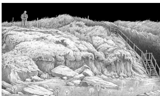
تصویر ۶. صفحه ۱۵، شب هفتم. شب‌گرد، (۲۰۱۵).

خرطوم فیل به دسته باعث می‌شود ما تخیل کنیم و جور دیگری ببینیم؟ آیا خرطوم فیل وسیله‌ای نگهدارنده است؟ (تصویر ۵) در نشان تصویری تحرک داشته باشید، آیا می‌توان با راه رفتن روی ابر تحرک را تجربه کرد؟ صدای جغجغه‌ها چگونه می‌آید؟ چطور می‌شود تعادل داشت؟ آیا روی رأس چیزی قرار گرفتن تعادل ایجاد می‌کند؟ آیا تصویر آدمک ایستاده روی لبه دسته تعادل را نشان می‌دهد؟ متن و تصویر در این فریم، نقطه مقابل هم هستند. کلمات و تصویر داستان‌های مختلفی دارند.