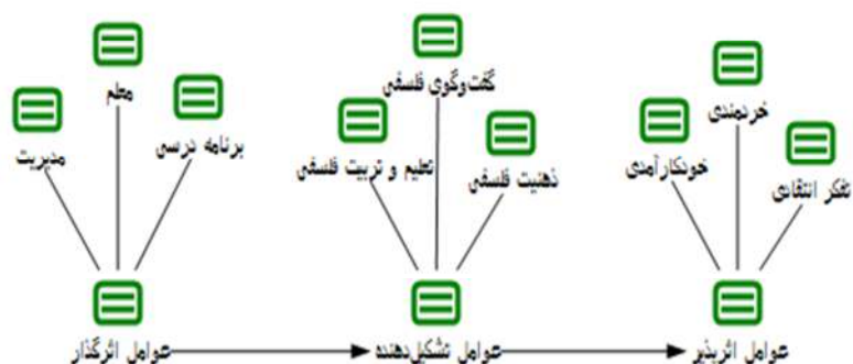
شکل ۶. مدل مفهومی پژوهش

شکل‌های فوق سهم فراوانی کدهای اولیه در شناسایی کدهای ثانویه را نشان می‌دهند. همان‌طور که در بالا مشخص شد، بعد از انجام تحلیل محتوای کیفی ۹ زیر مقوله کشف شد. در ادامه الگوی مفهومی از مقولات فوق ارائه می‌شود.